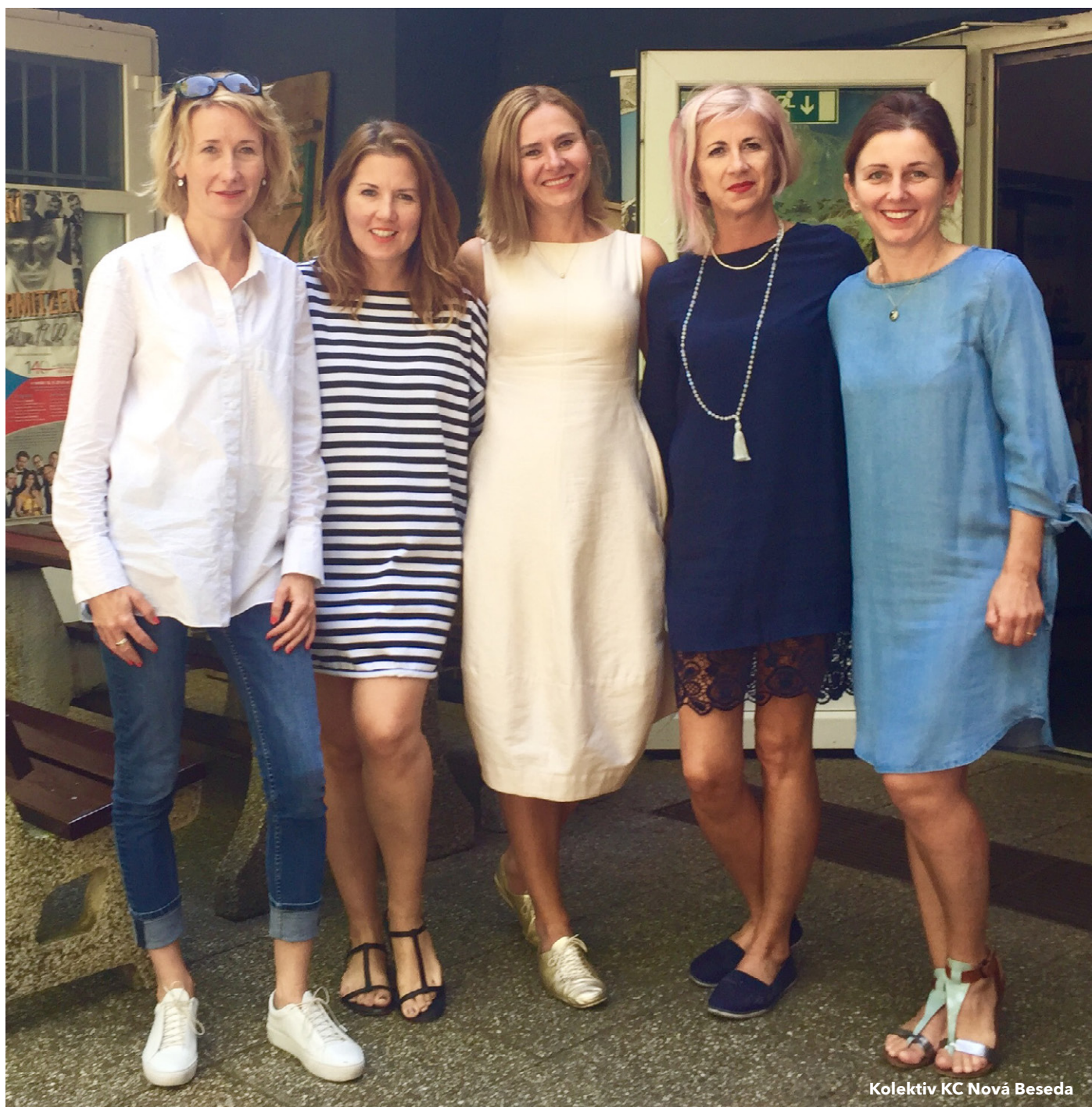
Kolektiv KC Nová Beseda