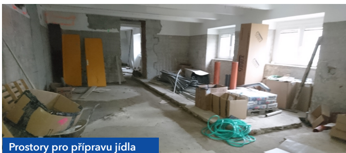
Prostory pro přípravu jídla

autoři: F. Polák, V. Gotthardt