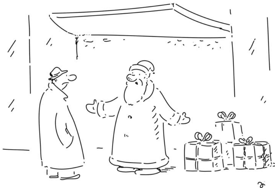
DOJÍMÁ MĚ VAŠE KUPNÍ SÍLA, PANE! CHCI ŘÍCT VAŠE LÁSKA K BLIŽNÍMU...

V pražské Betlémské kapli probíhá již 32. vánoční výstava, tentokrát s názvem Malované Vánoce. Jejím posláním je připomenout tradiční kouzlo českých lidových Vánoc. Letos je hlavním tématem malba, vytvořená nejrůznějšími výtvarnými technikami a objevující se na těch nejrozmanitějších podkladech. Během výstavy budou k vidění také různé výtvarné techniky, uskuteční se i 12. setkání řezbářů za účasti českých a slovenských špičkových umělců. Setkání krajkářek tentokrát obohatí ukázky různých technik vyšívání a tkaní. Výstava je otevřena od 25. 11. 2011 do 2. 1. 2012 denně od 9 do 18 hod. Ve dnech 24. 12. a 31. 12. 2011 od 9 do 14 hod., 25. 12. 2011 a 1. 1. 2012 od 13 do 18 hod.