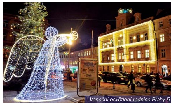
Vánoční osvětlení radnice Prahy 5

mocí. Pro příbuzné, stranické kolegy a kamarády se vytvořilo přes dvacet nových míst sekretářek, asistentů a poradců. Jen ať miliony tečou! Posledním dlouhým nosem všem občanům Prahy 5 je pořízení nevkusného vánočního „ozdobení“, kterému vévodí radniční budova, za 1,3 milionu korun... Skutečně pěkný dárek! Až tedy