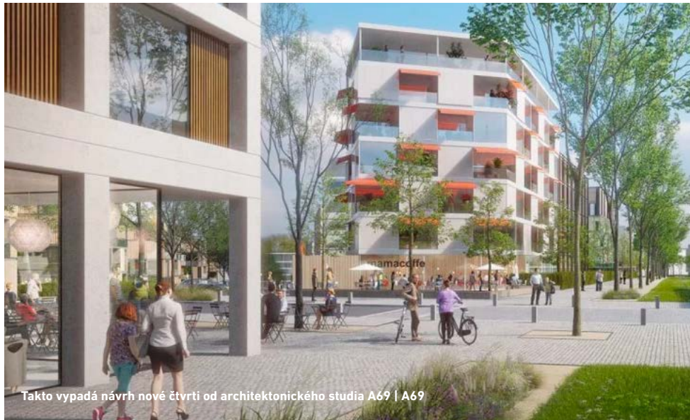
Fakto vypadá návrh nové čtvrti od architektonického studia A69 | A69

„Pro potřebný rozvoj města se developeri stávají silným partnerem. Na potřebnou vybavenost konečně přispívají stamiliony, aniž by přitom docházelo ke zdražení bydlení. Pro developery je totiž nejdražší čas, který by museli do projektu bez jasných pravidel a spolupráce s městem investovat navíc. Zkracuje se tím i čekání obyvatel na dobudování infrastruktury