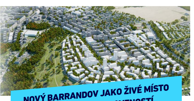
NOVÝ BARRANDOV JAKO ŽIVÉ MÍSTO S POTŘEBNOU VYBAVENOSTÍ

Opravujeme chodníky i tam, kde to nezdává TSK a hlavní město: