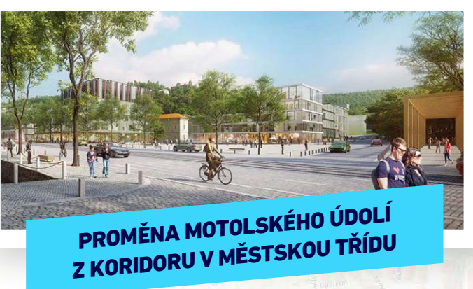
PROMĚNA MOTOLSKÉHO ÚDOLÍ Z KORIDORU V MĚSTSKOU TRÍDU