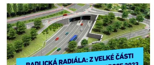
RADLICKÁ RADIÁLA: Z VELKÉ ČÁSTI POD ZEMÍ, START REALIZACE V ROCE 2023