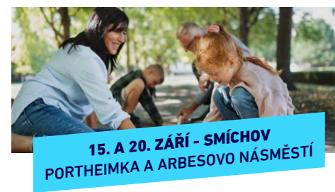
15. A 20. ZÁŘÍ - SMÍCHOV PORTHEIMKA A ARBESOVO NÁSMĚSTÍ