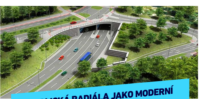
RADLICKÁ RADIÁLA JAKO MODERNÍ MĚSTSKÁ KOMUNIKACE, NE PŘÍKOP