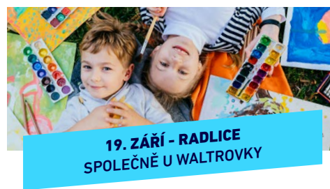
19. ZÁŘÍ - RADLICE SPOLEČNĚ U WALTROVKY