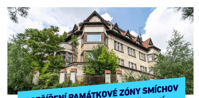
ROZŠÍŘENÍ PAMÁTKOVÉ ZÓNY SMÍCHOV PRO OCHRANU VILOVÝCH ČTVRTÍ