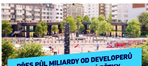
PŘES PŮL MILIARDY OD DEVELOPERŮ MÍŘÍ NA ROZVOJ CELÉ PĚTKY