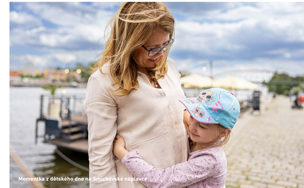
Momentka z dětského dne na Smíchovské náplavce