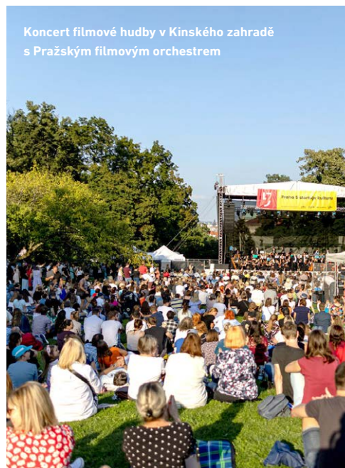
Koncert filmové hudby v Kinského zahradě s Pražským filmovým orchestrem