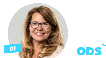
Mgr. Renáta Zajíčková starostka Prahy 5, poslankyně

Jako starostka jsem radnici otevřela lidem a pustila se do modernizace těžkopádného úřadu. Pětku chci moderní, zelenou a bezpečnou. Společně jsme proto nastartovali strategii rozvoje městské části, do její přípravy jsem zapojila desítky skvělých lidí včetně politické opozice i obyvatel z celé Pětky. Developerů tlačíme k enormním investicím do infrastruktury, striktně bráníme zeleň, rekordně investujeme do rozvoje a výstavby nových škol. Pětka konečně nese zátěž užitavbě drog za celou Prahu a ulice jsou bezpečnější. Důvěra Pražanů mi umožnila stát se poslankyní, což mi otvírá mnohé dveře, mám daleko více možností, jak svému městu pomáhat.