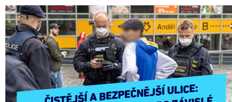
ČISTĚJŠÍ A BEZPEČNĚJŠÍ ULICE: PŘESOUVÁME CENTRUM PRO ZÁVISLÉ