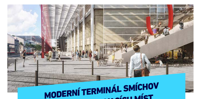
MODERNÍ TERMINÁL SMÍCHOV + 1500 PARKOVACÍCH MÍST