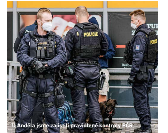
U Anděla jsme zajistili pravidelné kontroly PCR

Je členkou sněmovního Výboru pro vědu, vzdělání, kulturu, mládež a tělovýchovu, dále Podvýboru pro kulturu, Podvýboru pro regionální školství a celoživotní učení a také Stálé komise pro rodinu a rovné příležitosti.