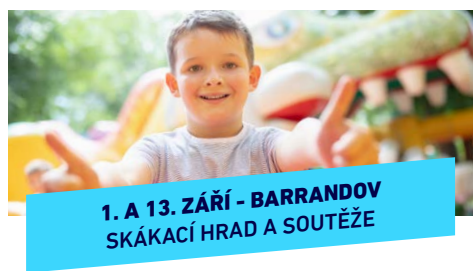
1. A 13. ZÁŘÍ - BARRANDOV SKÁKACÍ HRAD A SOUTĚŽE