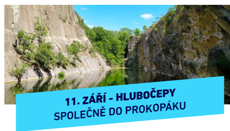
11. ZÁŘÍ - HLUBOČEPY SPOLEČNĚ DO PROKOPÁKU