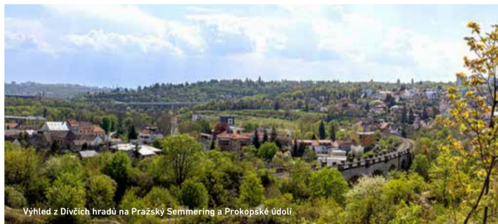
Výhled z Divčích hradů na Pražský Semmering a Prokopské údolí