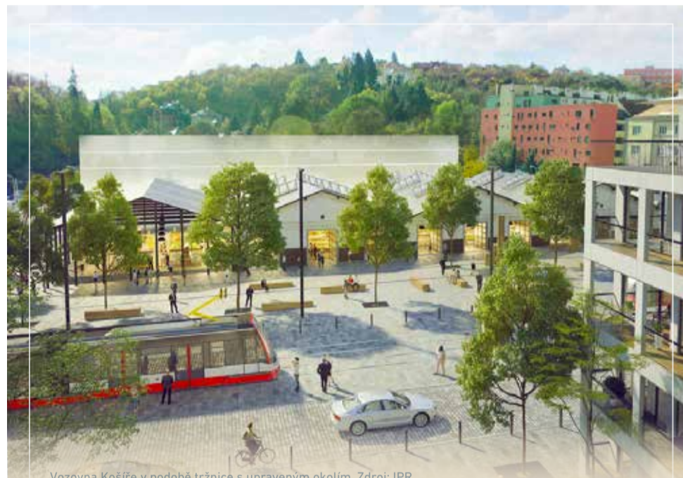
Vozovna Košíře v podobě tržnice s upraveným okolím.