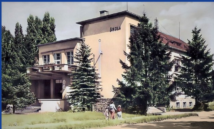
Základní škola, kde se ubytovali němečtí vojáci

Když se velitel ubezpečil, že je mužstvo řádně ubytováno a že je vojenská technika seřazena na trávnících před školou a v parku, dostavil se k zástupcům obce a položil jim řadu otázek. Zajímalo se, kde bydlí forstrat (lesní rada) Pichler. Zbylé otázky měly politicko-orientační ráz. Ptal se na počet odevzdaných hlasů v obci v posledních parlamentních volbách pro komunistickou stranu, kolik je v obci těžkých zbraní, kde je nejbližší posádka apod. Po rozmluvě se velitel odebral pozdě večer v automobilu směrem