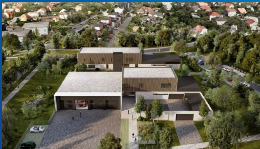
Vizualizace nové budovy IZS

diskusích a úpravě požadavků na zbrojnici vznikla studie, jejíž vizualizaci vidíte na obrázku. Podle informací z Magistrátu se v současné době dokončuje příprava dokumentace pro stavební řízení, kterou má na starost ostravské architektonické studio Kania a.s. Pokud hlavní město uvolní finanční prostředky, měly by v příštím roce následovat další kroky: soutěž na zhotovitele prováděcí dokumentace a na stavební firmu, která objekt IZS zrealizuje. Stavět by se tedy teoreticky mohlo začít v roce 2023. Projekt nové budovy IZS přináší vedle zkvalitnění služeb ještě další benefit. Uvolní se prostor mezi základní školou a radnicí, který je pro výjezd požární techniky nevhodný, dojde ke zklidnění celé oblasti a možnosti vytvořit v těchto místech přirozené centrum naší obce pro služby a komunitní život.