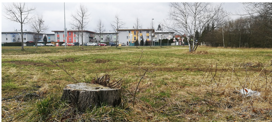
Pozemek pro výstavbu budovy IZS.

Navrhujeme vypracovat strategický materiál Koncepce rozvoje Klánovic, který by měl z dlouhodobého hlediska definovat urbanisticko-stavební „cílový stav“ naší městské části. Mělo by v něm být popsáno, jak si Klánovice představují využití volných ploch. Myslíme si, že je třeba vědět, kde by měla pokračovat bytová výstavba, kolik to znamená nových obyvatel, jak bude řešena doprava a kde a v jakém rozsahu by měly být umístěny školy, obchody a stavby pro sportovní nebo kulturní využití.