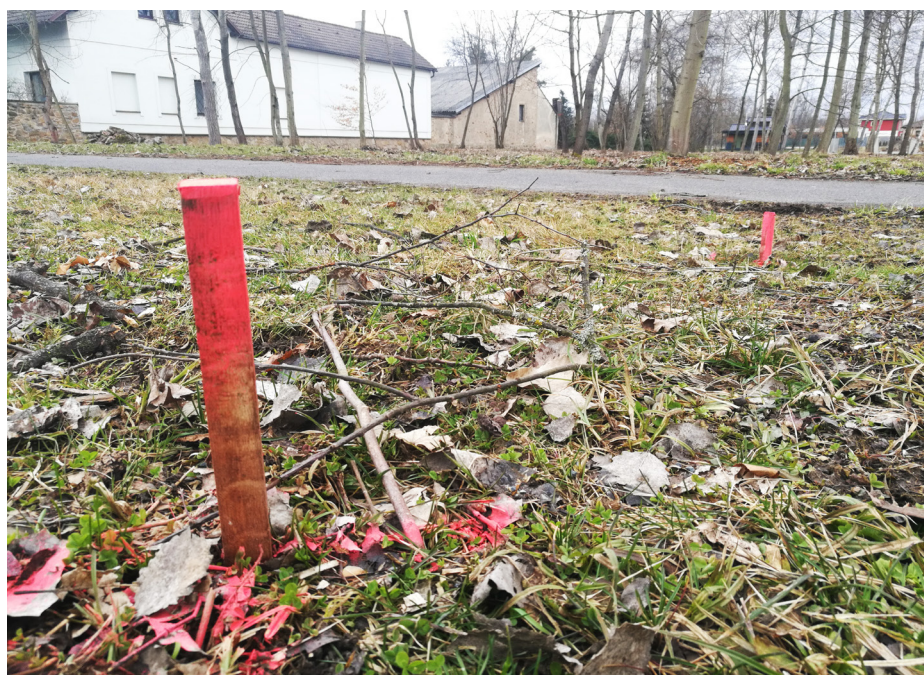
V severní části Přímského náměstí se začíná s úpravou pozemků

Pokud bude mít MČ vypracovanou strategii svého rozvoje, tak bude pro majitele místních nemovitostí, developery, investory i malé stavebníky čitelnějším partnerem a její pozice v obhajování vlastních stanovisek bude mnohem lepší.