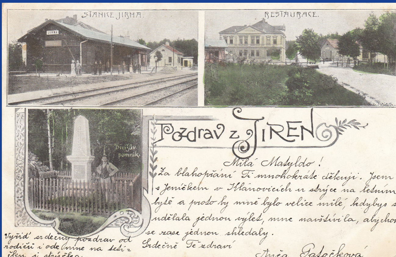
1. Stará budova nádraží s přilehlým domkem v místech, kde je dnes signální sloup 2. Železniční přejezd s budovou restaurace U Daschů 3. Pískovcový pomník u železniční trati vpravo ve směru do Prahy. Postaven byl na připomenutí vraždy lesního adjunkta Huberta Divíše roku 1880