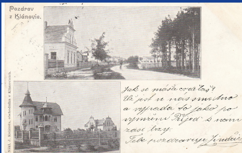
1. Hlavní ulice a restaurace U Patočků, dnešní budova pošty 2. Vila velkoobchodníka Petrovického vedle pošty č.p. 31

Pokračování a mnohem více bude následovat v dalších číslech KLÁNŮVIN.