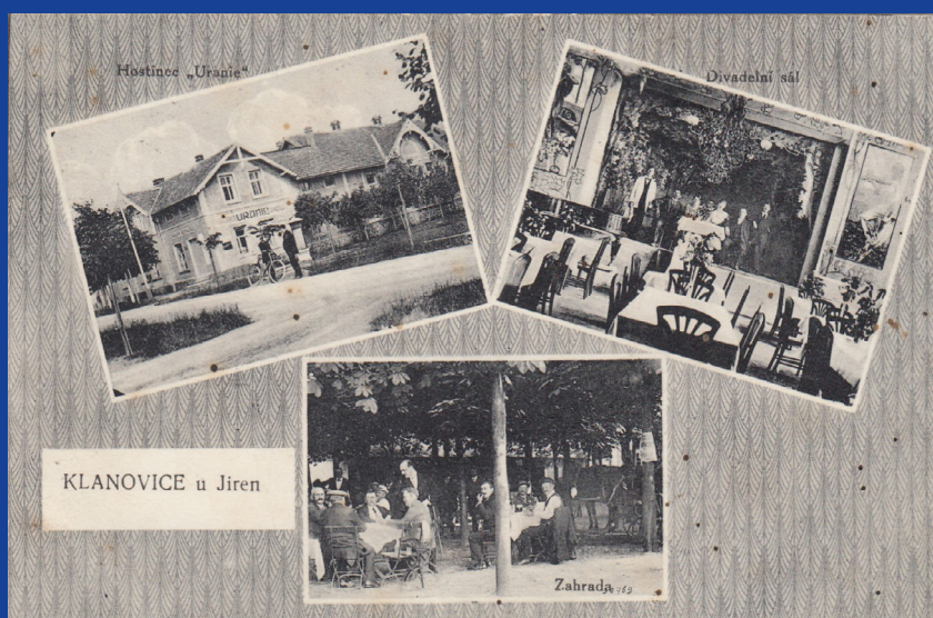
Dobová pohlednice restaurace Uránie, dnešní Babiččina Beseda

Z výše řečeného by se čtenář mohl domnívat, že úspěch Klánovic spočíval ve finančním zabezpečení obce, ale ta měla například v roce 1934 (po dostavění Masarykovy školy) přírážkovou základnu pouze 23.700 tehdejších korun, a když vezmeme