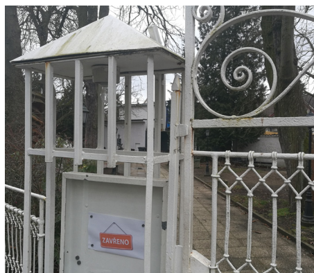
KC Beseda na svého nového provozovatele zatím čeká

V minulém čísle Klánovin jsme Vás informovali o poněkud kostrbatém procesu výběru nového provozovatele KC Beseda. Členové RMČ hlasovali o předložených nabídkách podle kritérií, která navrhla Komise pro výběr provozovatele a 22.7.2020 je schválila RMČ.