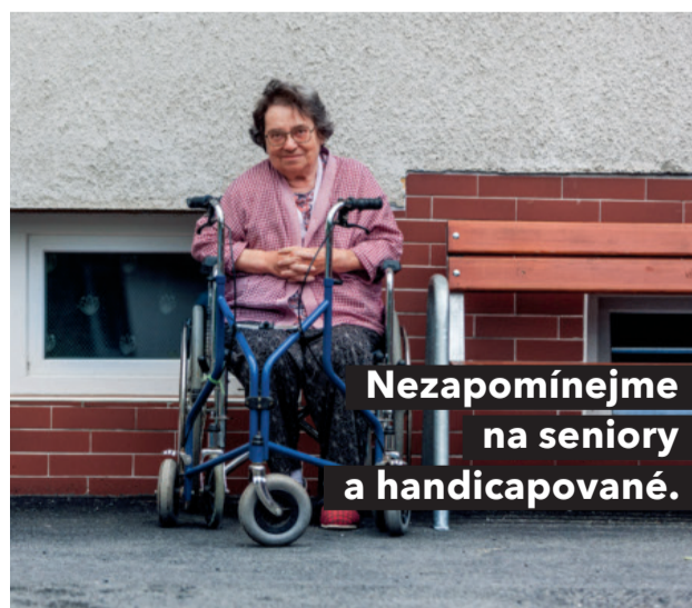
Nezapomínejme na seniory a handicapované.

„Pokud máme hovořit o skutečně efektivní pomoci seniorům a handicapovaným spoluobčanům, je nezbytné rozšířit systém