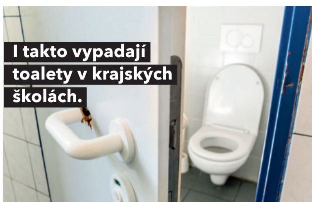
I takto vypadají toalety v krajských školách.

Všichni skloňují, jak se musíme připravit na riziko šíření covidu, kraj ale není schopen zajistit ani tu základní věc, kvalitní hygienické podmínky. Proto spustíme speciální program na zkvalitnění sociálního zázemí ve středních školách. Je to důležité nejenom za současných hygienických podmínek, ale i proto, že moderní záchody prostě do 21. století patří.