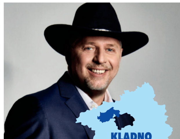
PETR BENDL (* 24. 1. 1966) V letech 1994 až 1998 kladenský primátor, 2000 až 2008 historicky první středočeský hejtman. V roce 2009 krátce ministr dopravy ČR, 2011 až 2013 ministr zemědělství ČR. Poslanec Parlamentu ČR.