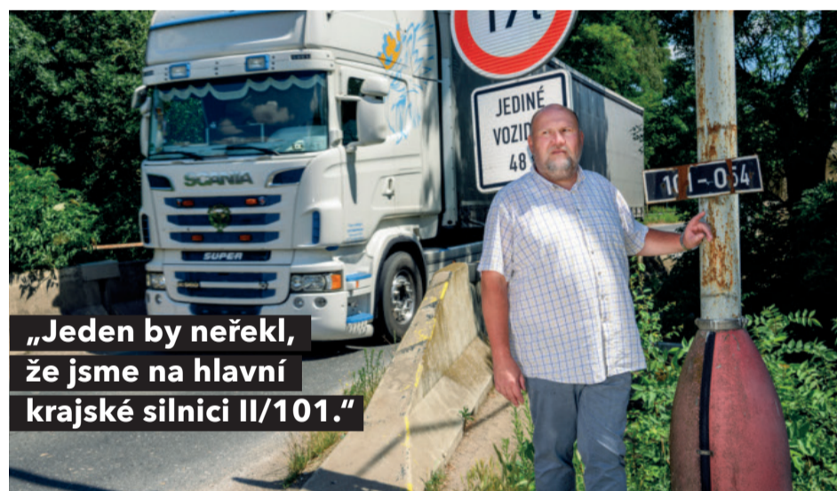
„Jeden by neřekl, že jsme na hlavní krajské silnici II/101.“

Mosty a mostky mají odjakživa lidi spojovat, pomoci jim překonat překážky v cestě. Ty středočeské ale v důsledku nulové koncepce oprav a údržby začínají být problémem, který kraji přerůstá přes hlavu!