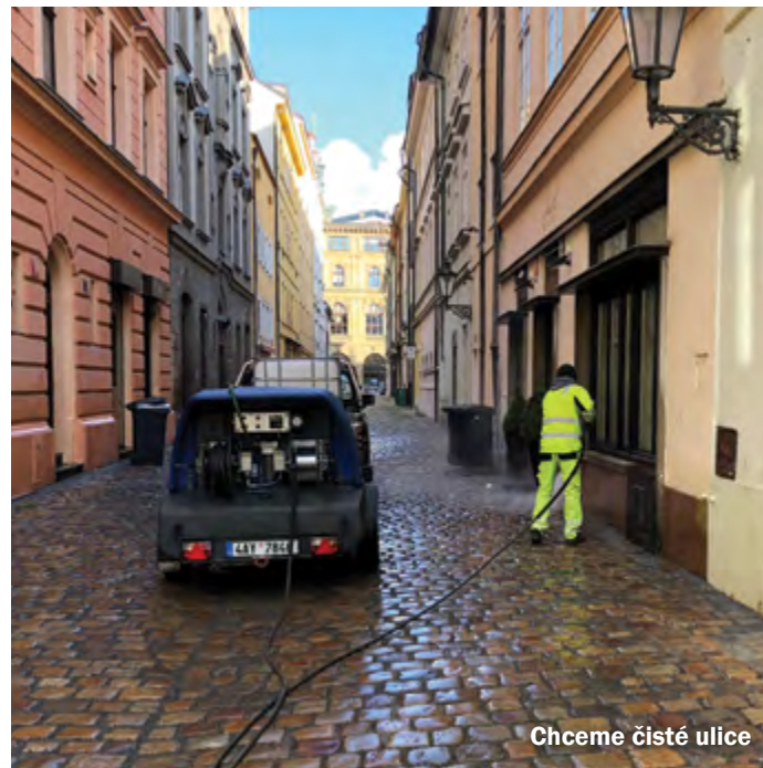
Chceme čisté ulice

Přestože chodníky spadají do správy hlavního města Prahy, snažíme se o ně pečovat. Po personálních změnách, které se udály v TSK (Technická správa komunikací), se naše spolupráce viditelně zlepšila. O tom svědčí také dokončení ulice Karolíny Světlé. V tomto roce plánujeme dokončení oblasti od Smetanova nábřeží až po Anenské náměstí. I nadále chceme pokračovat v opravách chodníků na Starém Městě, kde jako Městská část Praha 1 posledních několik let spojujeme svou činnost s akcí společnosti PRE, která provádí rozsáhlou obnovu kabelů. Praha 1 tak spojuje nutné výkopy s kompletním