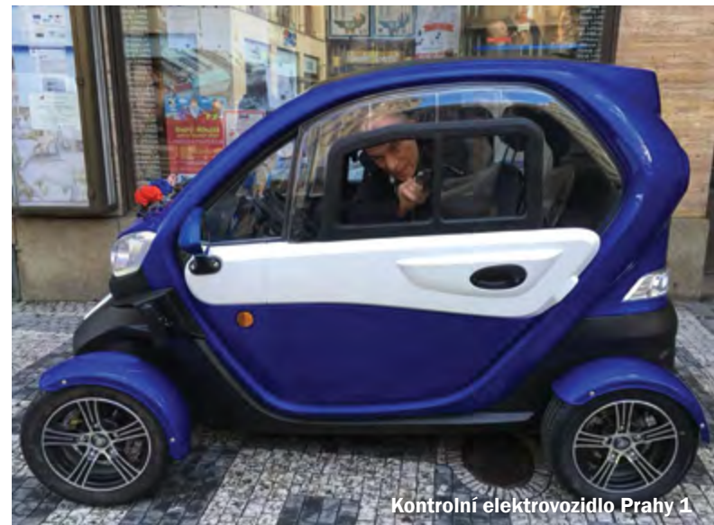
Kontrolní elektrovozidlo Prahy 1

zkvalitňováním povrchů chodníků v dotčených oblastech. Výsledkem tak je, že všechny zasažené chodníky jsou uvedeny do lepšího stavu, než tomu bylo před výměnou elektrického vedení. Občané i podnikatelé působící na Starém Městě tak výměnou za dočasné omezení dostanou alespoň upravené chodníky.