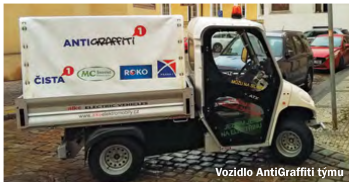
Vozidlo AntiGraffiti týmu