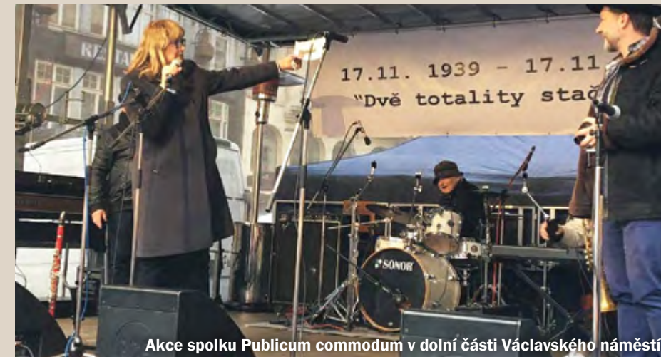
Akce spolku Publicum commodum v dolní části Václavského náměstí

Pořadatelé akce v médiích prezentovali jako naprosto apolitickou. Realita ukázala naprostý opak. Ve zkratce lze říci, že koncert rozdělil společnost na dvě skupiny. Na ty, kteří reprezentují či podporují tzv. Kroměřížskou výzvu, a ty ostatní. Ti měli smůlu. Na pódiu se objevili prezidentští kandidáti. Ale jen tři. Zelenou dostali pouze Marek Hilšer, Jiří Drahoš a Pavel Fišer. Ostatní na pódium nesměli. Odmítnut byl třeba Michal Horáček, nedostalo se ani na Mirka Topolánka, stávající prezident Zeman oslavy vynechával, netřeba ale pochybovat o tom, že pořadatelům nijak nechyběl. Například Horáčkovu odmítnutí je přitom do očí bijící. Ať byla jeho minulost jakákoliv, zůstává faktem, že jeho role v někdejších pohnutých listopadových událostech roku 1989 byla nepřehlédnutelná. Iniciativa MOST, kterou založil společně s Michalem Kocábem (ať již z jakýchkoliv