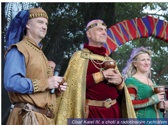
Císař Karel IV. s chotí a radotínským rychtářem

Jeho císařská milost nechala druhý červnový den své radotínské poddané čekat přeci jen déle, než jak jsou jeho věrní zvyklí. Nikdo však neodešel, proč také? Šermíři (Rotyka) předváděli své umění, dobová hudba (Antiquarius) se linula celým prostranstvím mezi kostelem a základní školou, lahodný mok z révy vinné provoněl celý nově pojmenovaný rynek Sv. Petra a Pavla, a tak nebyl důvod ke spěchu. Před půl čtvrtou odpolední se několik stovek přihlížejících dočkalo: