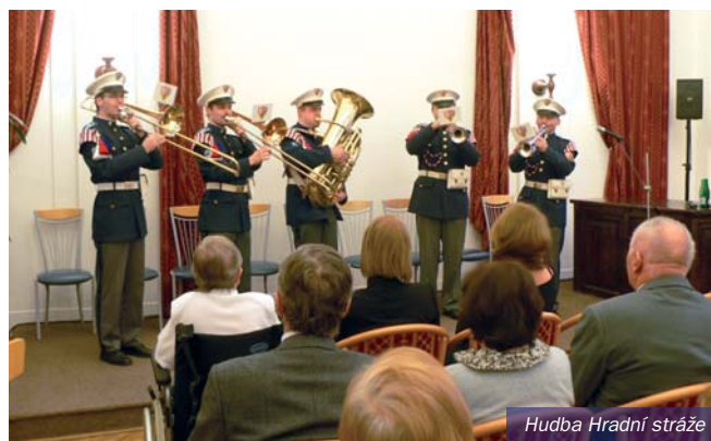
Hudba Hradní stráže