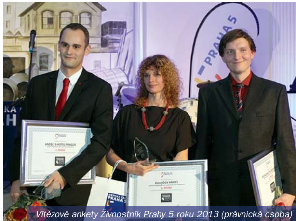
Vítězové ankety Živnostník Prahy 5 roku 2013 (právníká osoba)

Kdokoliv mohl vyplnit nominální formulář a dát porotě tip na zajímavého podnikatele nebo firmu. O konečném pořadí pak rozhodla porota