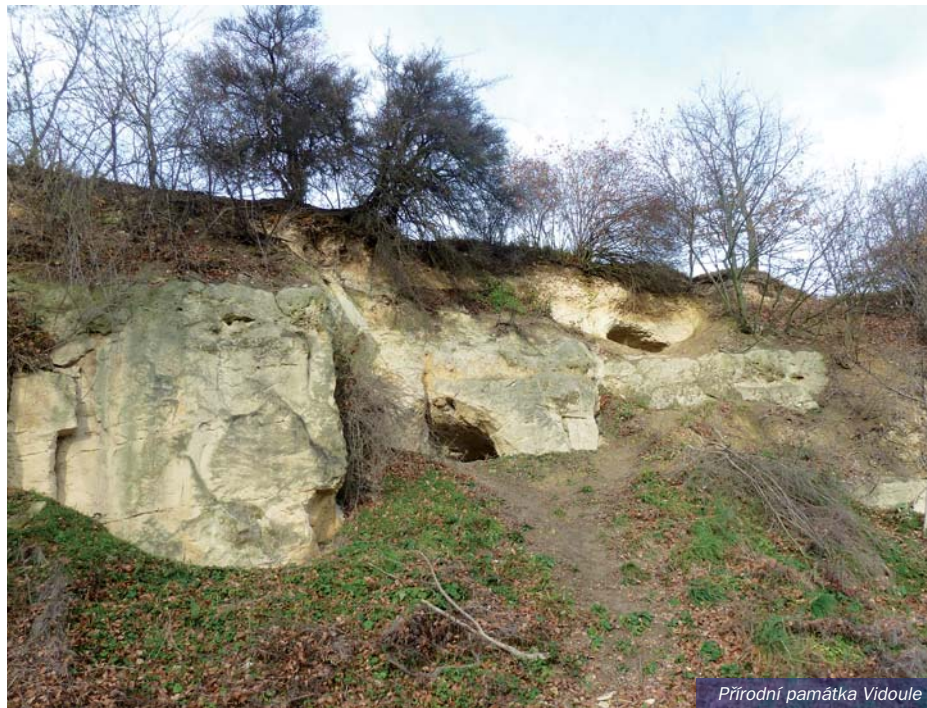
Přírodní památka Vidoule