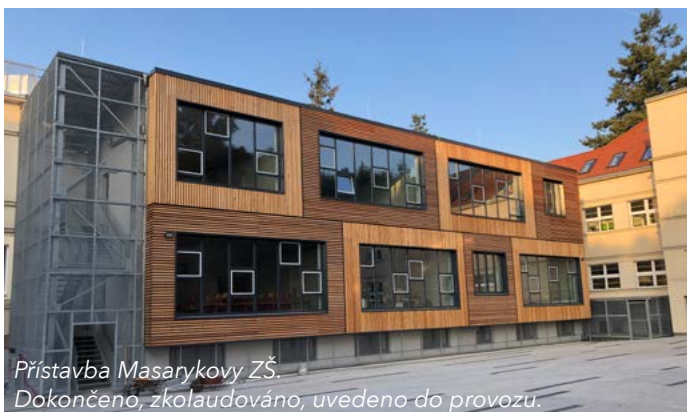
Přístavba Masarykovy ZŠ. Dokončeno, zkolaudováno, uvedeno do provozu.