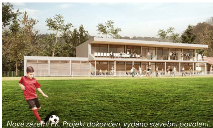
Nové zázemí FK. Projekt dokončen, vydáno stavební povolení.