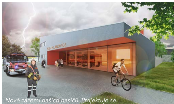
Nové zázemí našich hasičů. Projektuje se.