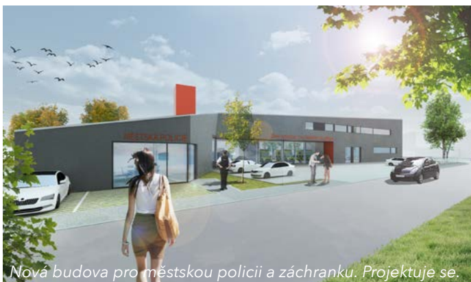
Nová budova pro městskou policii a záchranku. Projektuje se.