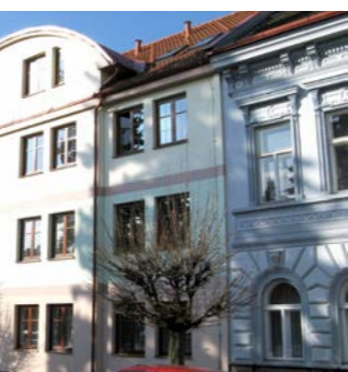
zateplení mateřské školy Jonášova