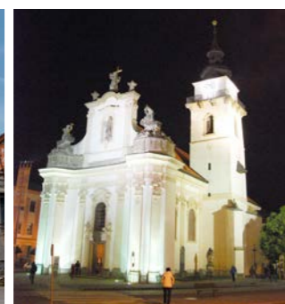
slavnostní nasvícení kostela