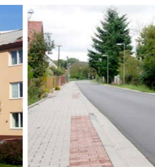
kanalizace a chodník Barákova