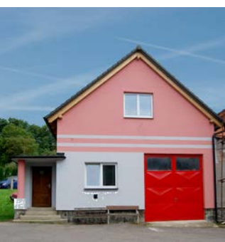
rekonstrukce hasičské zbrojnice Konopáč