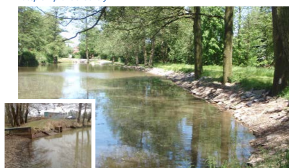
odbahnění průhonských rybníků