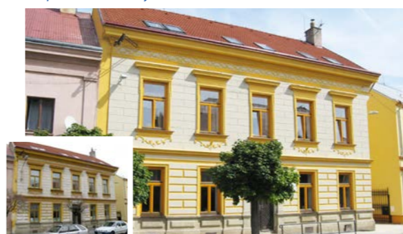
zateplení praktické školy