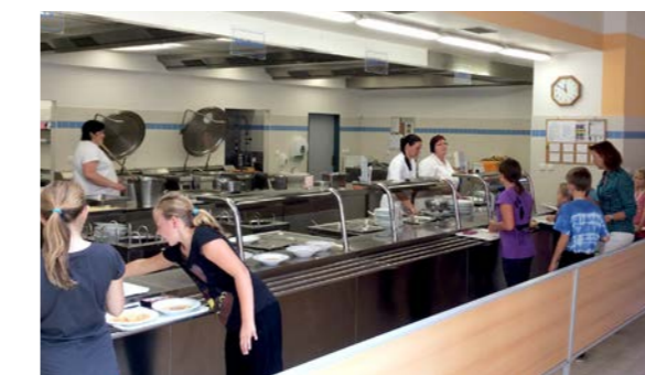
nová školní jídelna