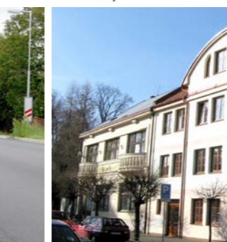
dům pro seniory