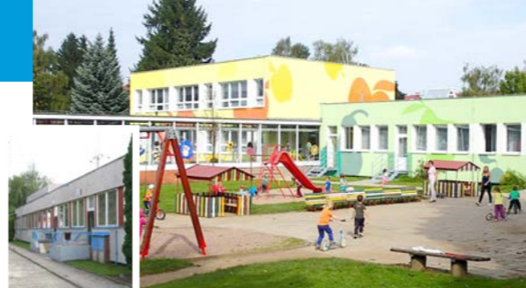
zateplení mateřské školy Jiráskova