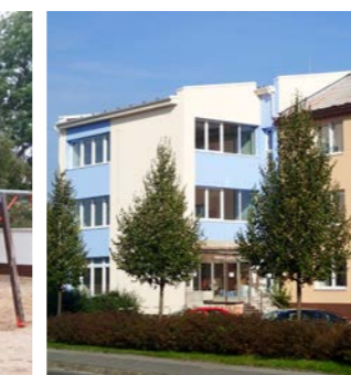
zateplení nové radnice